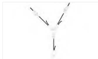
32900 und 32979 Befestigungspunkt mit Drop

Bitte beachten: Zur Bearbeitung der Bestellung ist eine genaue Positions- und Höhenangabe der benötigten Befestigungspunkte erforderlich. Vermaßte Standskizze (Maßstab 1:100 oder 1:50) bitte unbedingt beifügen. Abhängungen von Standbauteilen und die Absicherung von Standbauteilen oder Exponaten mit Abhängungen sind nicht zulässig!